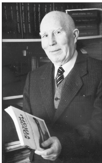
Марс Шабаев (1933–2008) шагыйрь, язучы, тәржемәче.